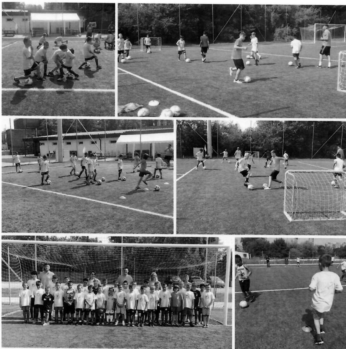
1. Nyári focitábor

Idén is rendeztünk nyári focitábort. Amelyet nagyon nagy sikerrel sikerült megrendeznünk. A táborban a gyerekek a napi 2 edzés mellett, 3x-i érkezést kaptak. Emellett többek között moziban, Tarzan Parkban is voltak a gyerekek. Természetesen jövőre is tervezzük a tábor megrendezését.