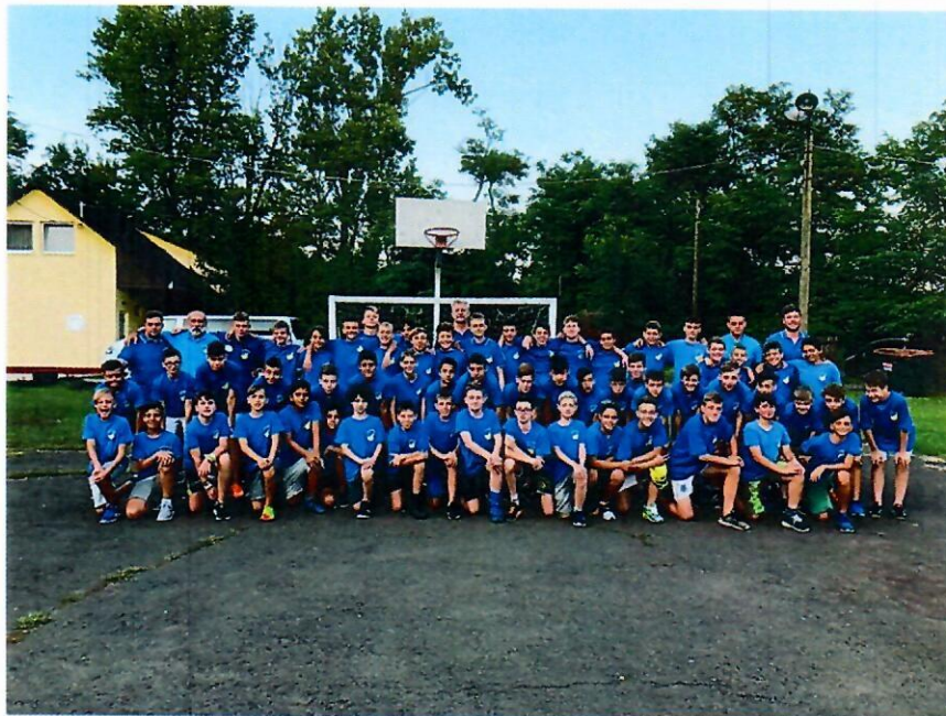
1. Edzőtábor Gyomaendrődön

Ezen kívül edzőtáborban vettek részt serdülő-, illetve ifjúsági csapataink a Gyomaendrődi táborban.