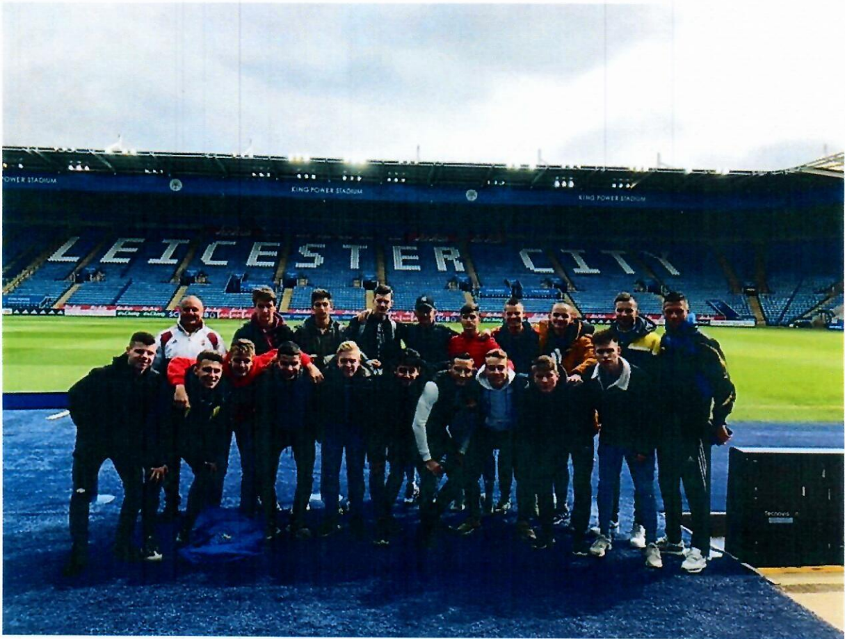
1. Torna Angliában

Ezen kívül edzőtáborban vettek részt serdülő-, illetve ifjúsági csapataink a Gyomaendrődi táborban.