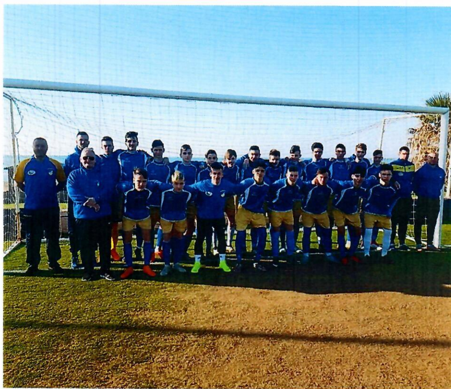
1. Edzőtábor Törökországban

A REAC Sportiskola SE válogatottal idén is sikerült eljutnunk külföldi edzőtáborba Törökországba. valamint egyrangos U19-es tornán is részt vettünk többek között olyan csapatok ellen, mint a Leicester City, vagy a korábbi 2-xes BEK győztes Nottingham Forest együttese.