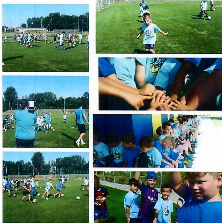
1. Nyári focitábor

Az ifjúsági csapataink teljesítménye 2019-ben szintén büszkeségre ad okot, hiszen nemcsak, hogy legidősebb csapatunk vezet a bajnokságot, hanem az U19-es csapatunk mellett, az U18-as, illetve az U17-es csapataink is első helyen állnak.